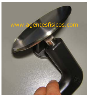
Fig. 5 – Electrodo de RF resistiva.