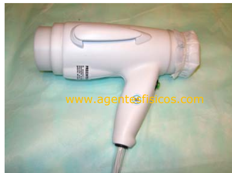
Fig. 4 – Aplicador de RF capacitiva bipolar.