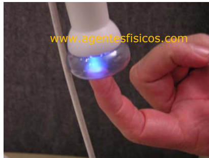
Fig. 1 – RF inductiva

Continuando con la línea de tiempo, en el año 1920 aproximadamente, es creado el chispómetro que poseía unas ampollas de vidrio con un gas dentro donde se generaba un arco voltaico entre el equipo y el paciente. Desde ya su tecnología también era sumamente sencilla y sus riesgos altos pero sirvió para dar una base al generador inductivo de calor, un equipo con muchos años en el mercado latinoamericano. Este último posee también ampollas de diferentes formas (Fig.1) que se adaptan a cada uso y necesidad. En la actualidad algunos fabricantes han actualizado la tecnología empleada en ellos, reemplazando las antiguas válvulas por transistores, haciendo que bajen los costos del equipo y que mejore su calidad de la emisión.