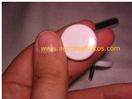
Fig. 3 – Electrodo capacitivo (activo de un equipo bipolar).

Resulta muy fácil diferenciar entre equipos capacitivos y resistivos. Los capacitivos poseen un aislante creando un capacitor (de ahí su nombre) (Fig. 3 y 4) y los resistivos son metálicos, conductores (Fig. 5 y 6).